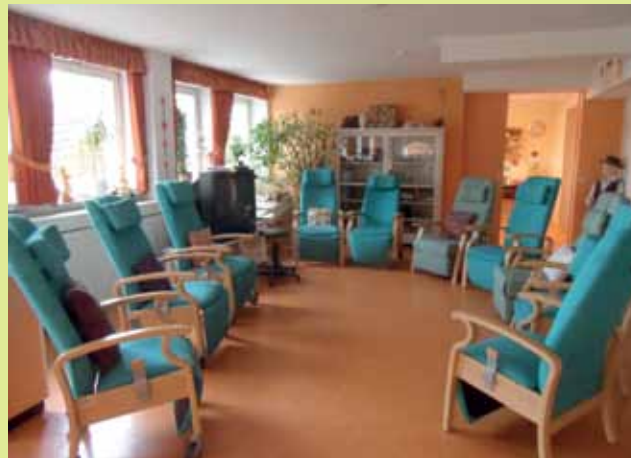
Foto: Aufenthaltsraum der Tagesbetreuung Drachenfelsblick © EFHiR

Das Team wird durch ehrenamtliche Seniorenbegleiterinnen und -begleiter unterstützt, die regelmäßig den Tag mitgestalten.